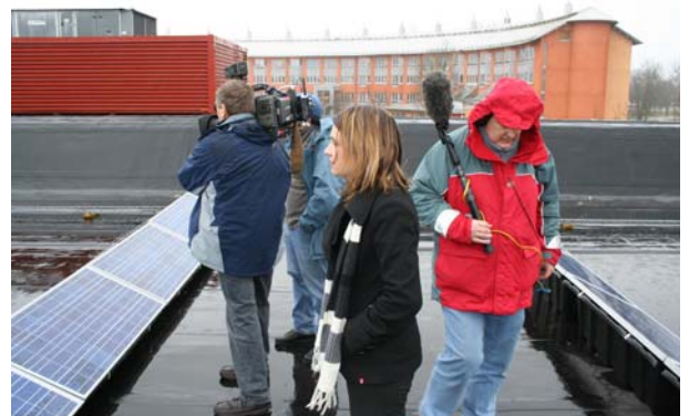
Växjö visade sig inte från sin mest soliga sida vid besöket. Trots det genererade solcellerna energi.